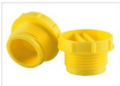
Všechny rozměry v mm

Navrženo pro ochranu BSP, metrického kování a závitů před poškozením a znečištěním. Vroubkovaná hlavice a otvor pro šroubovák umožňují snadnou montáž a demontáž.